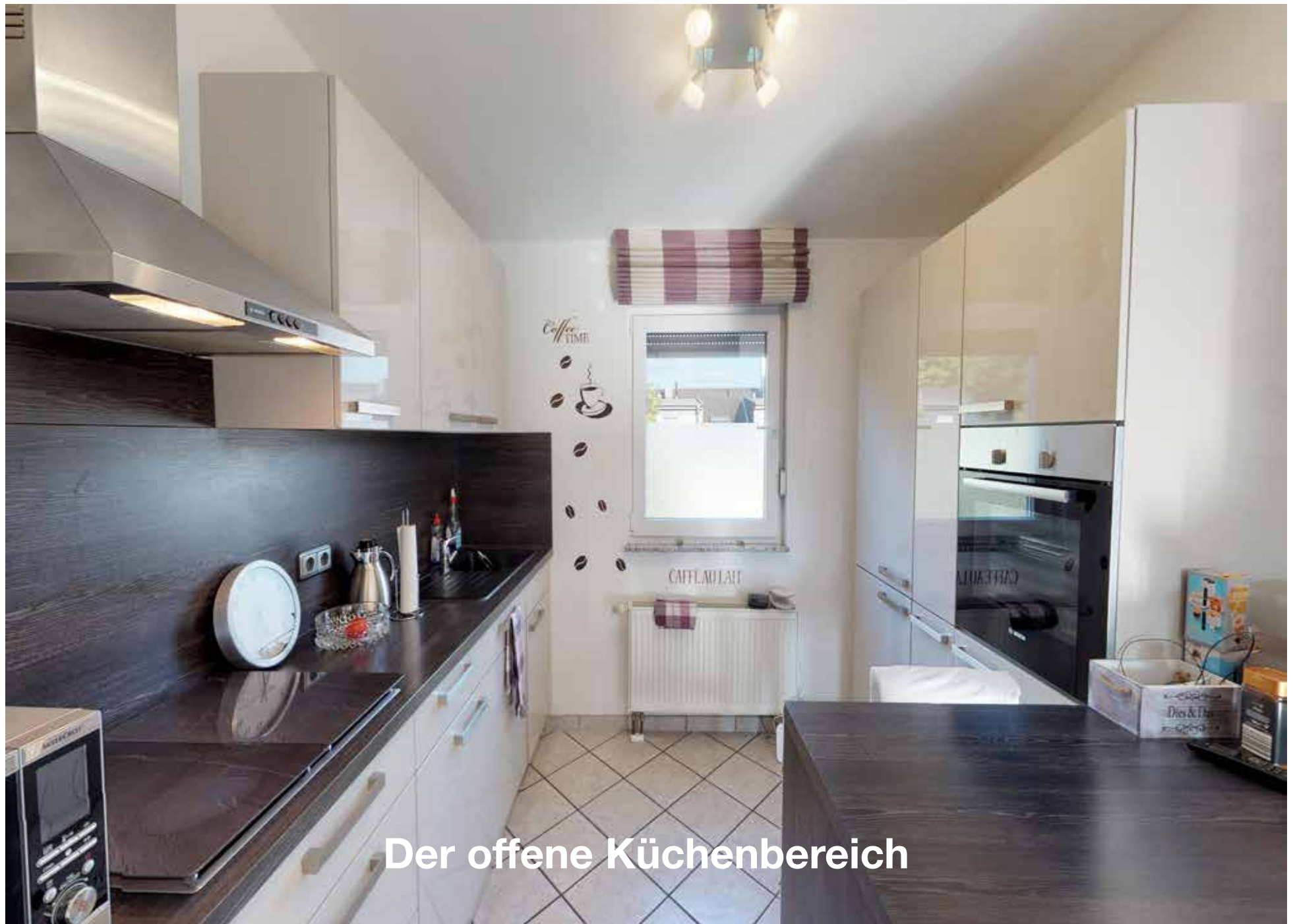
Der offene Küchenbereich