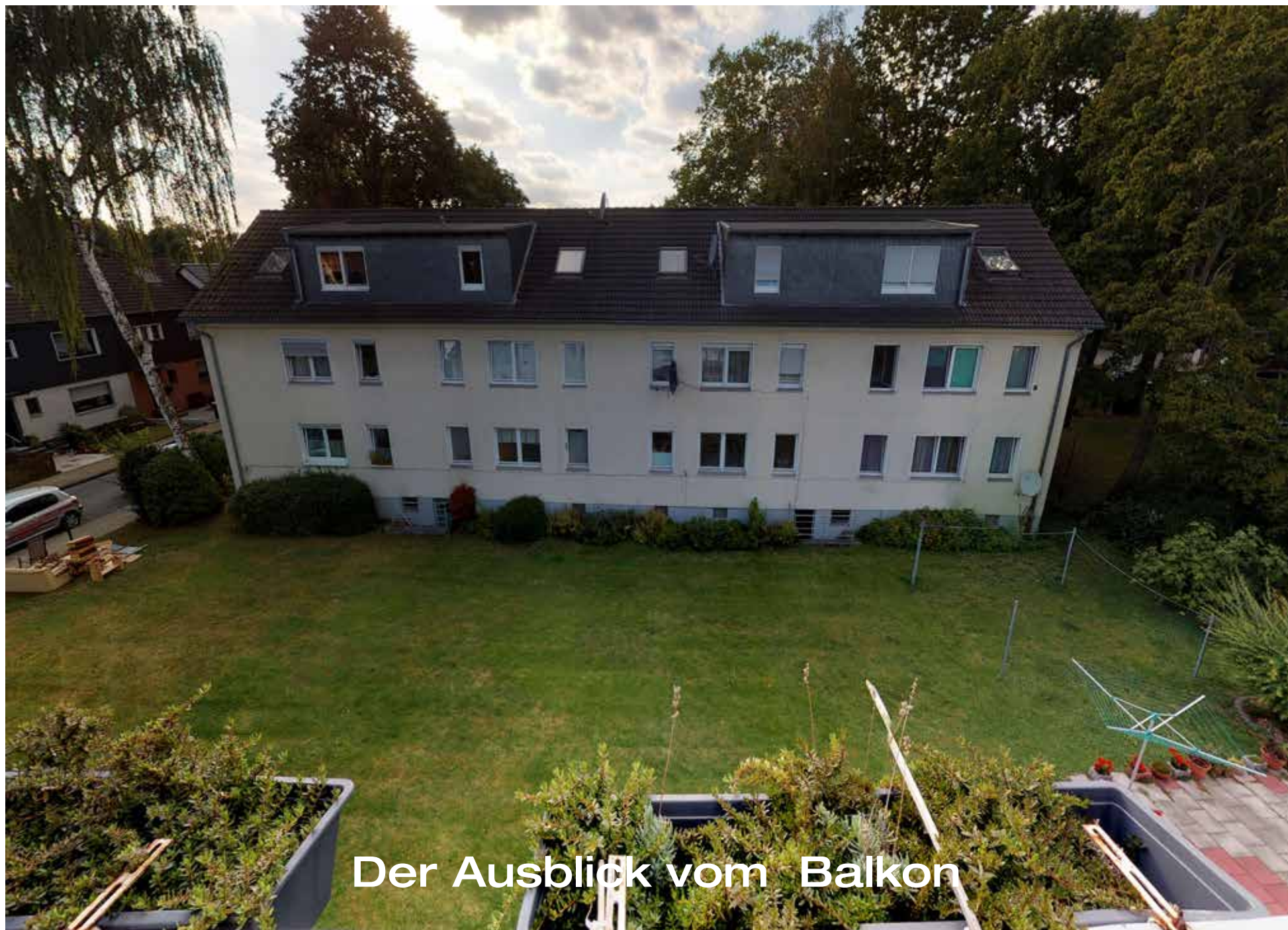
Der Ausblick vom Balkon