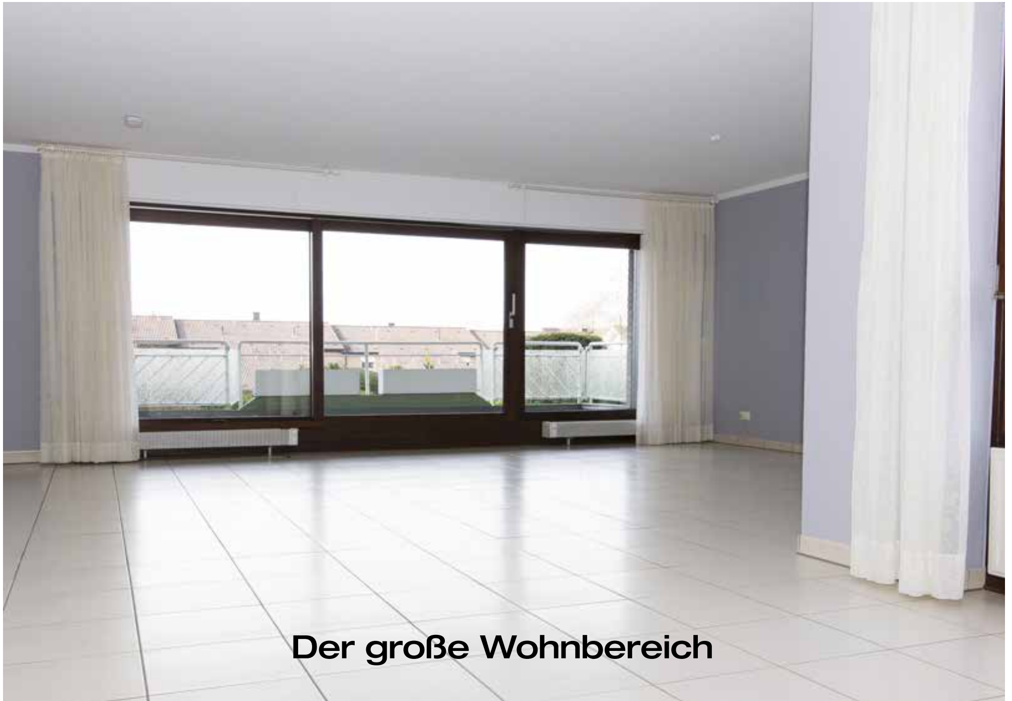
Der große Wohnbereich