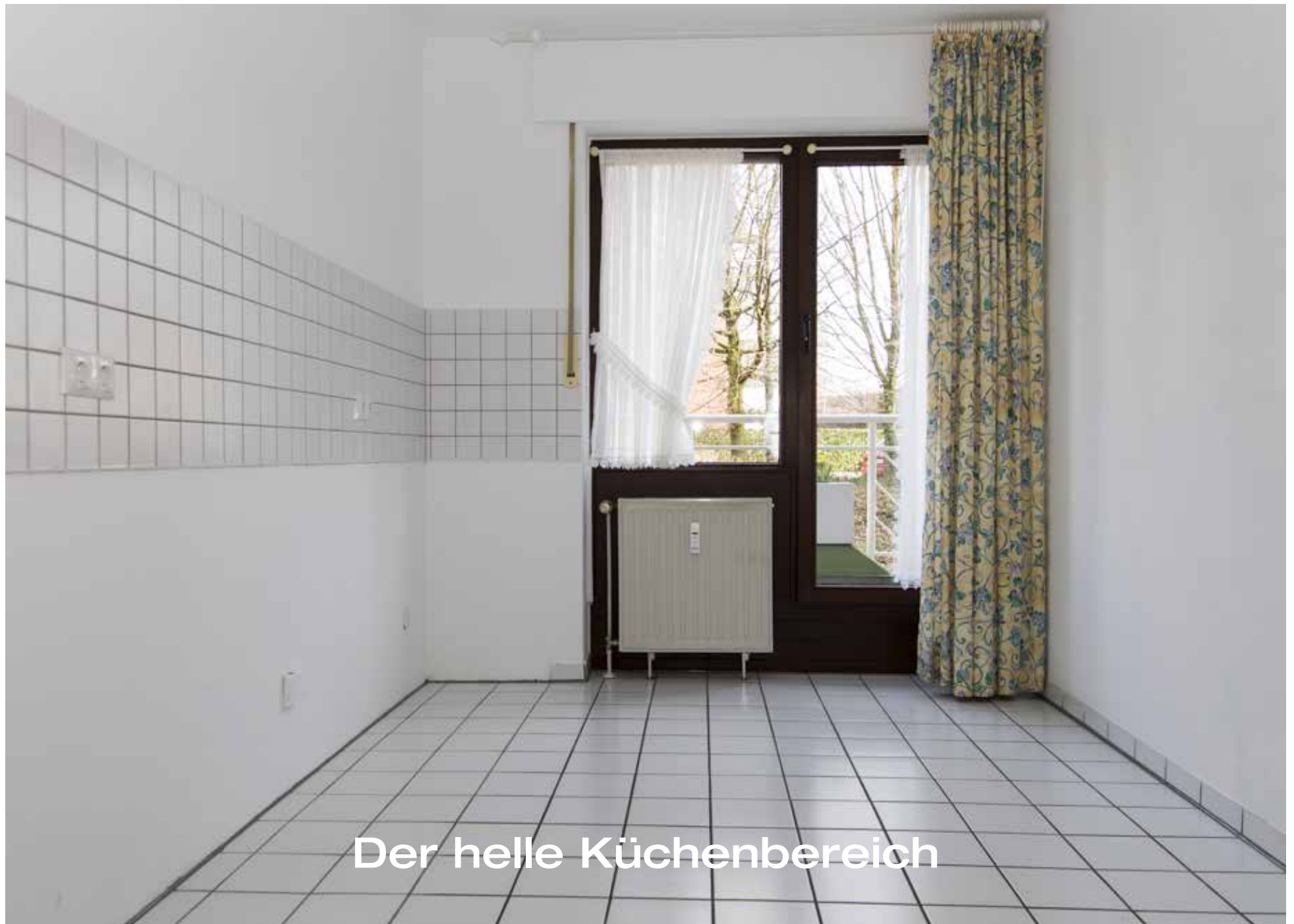
Der helle Küchenbereich