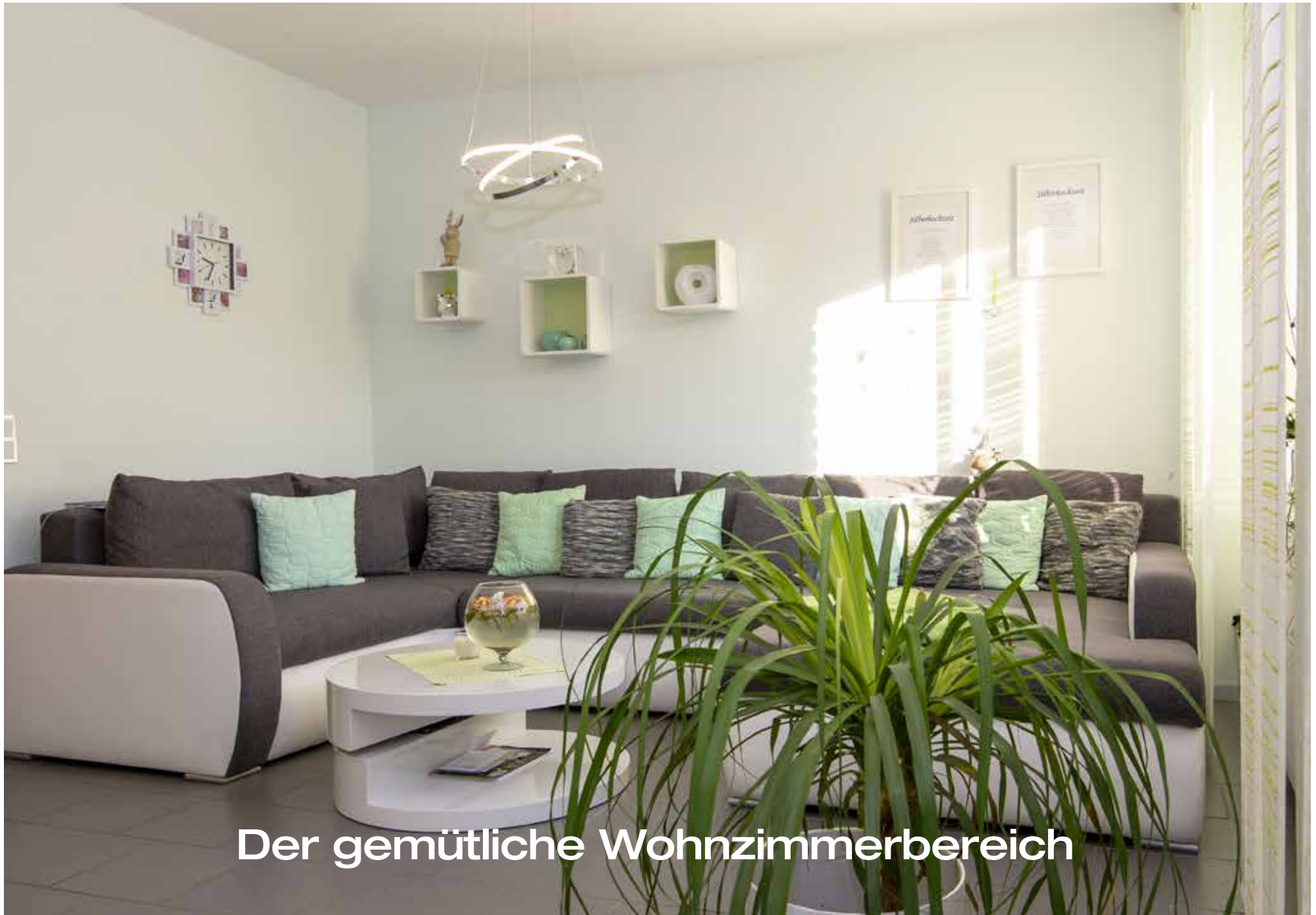
Der gemütliche Wohnzimmerbereich