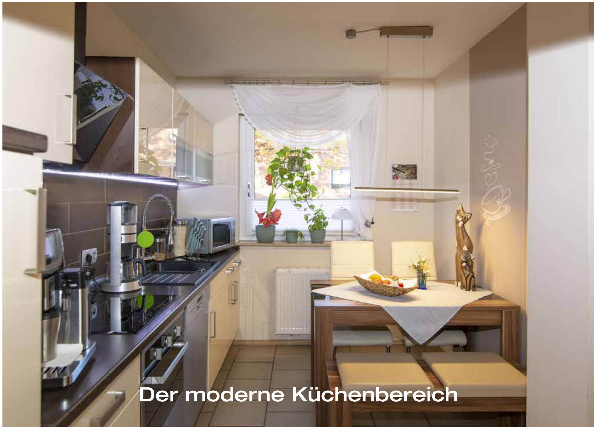
Der moderne Küchenbereich