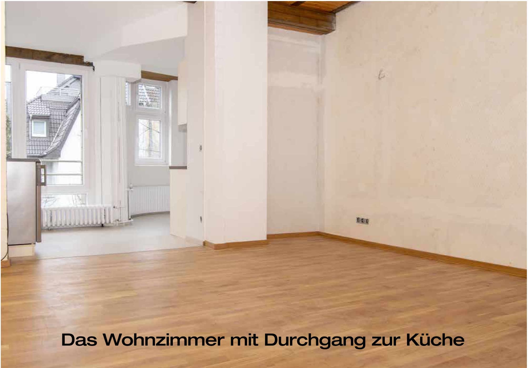
Das Wohnzimmer mit Durchgang zur Küche