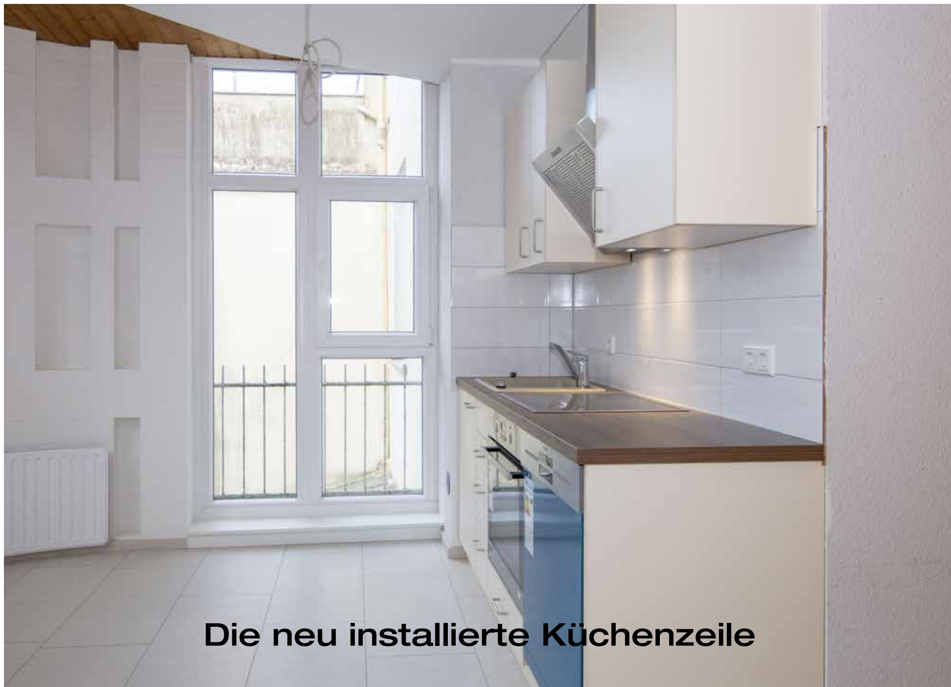
Die neu installierte Küchenzeile