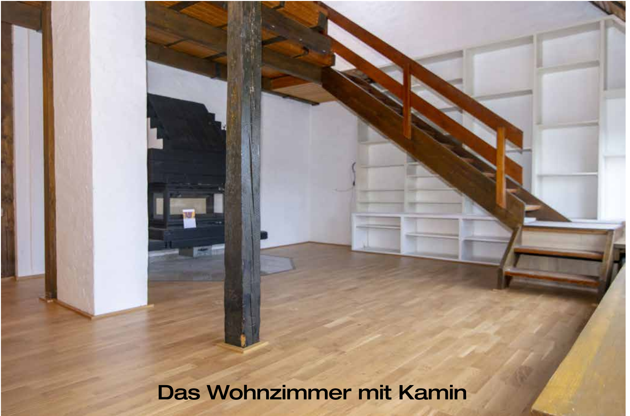
Das Wohnzimmer mit Kamin