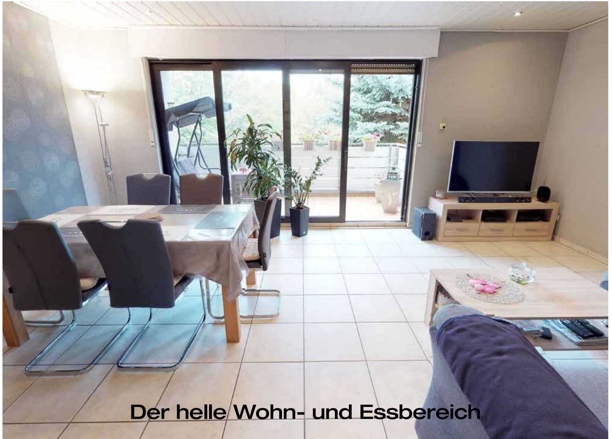
Der helle Wohn- und Essbereich