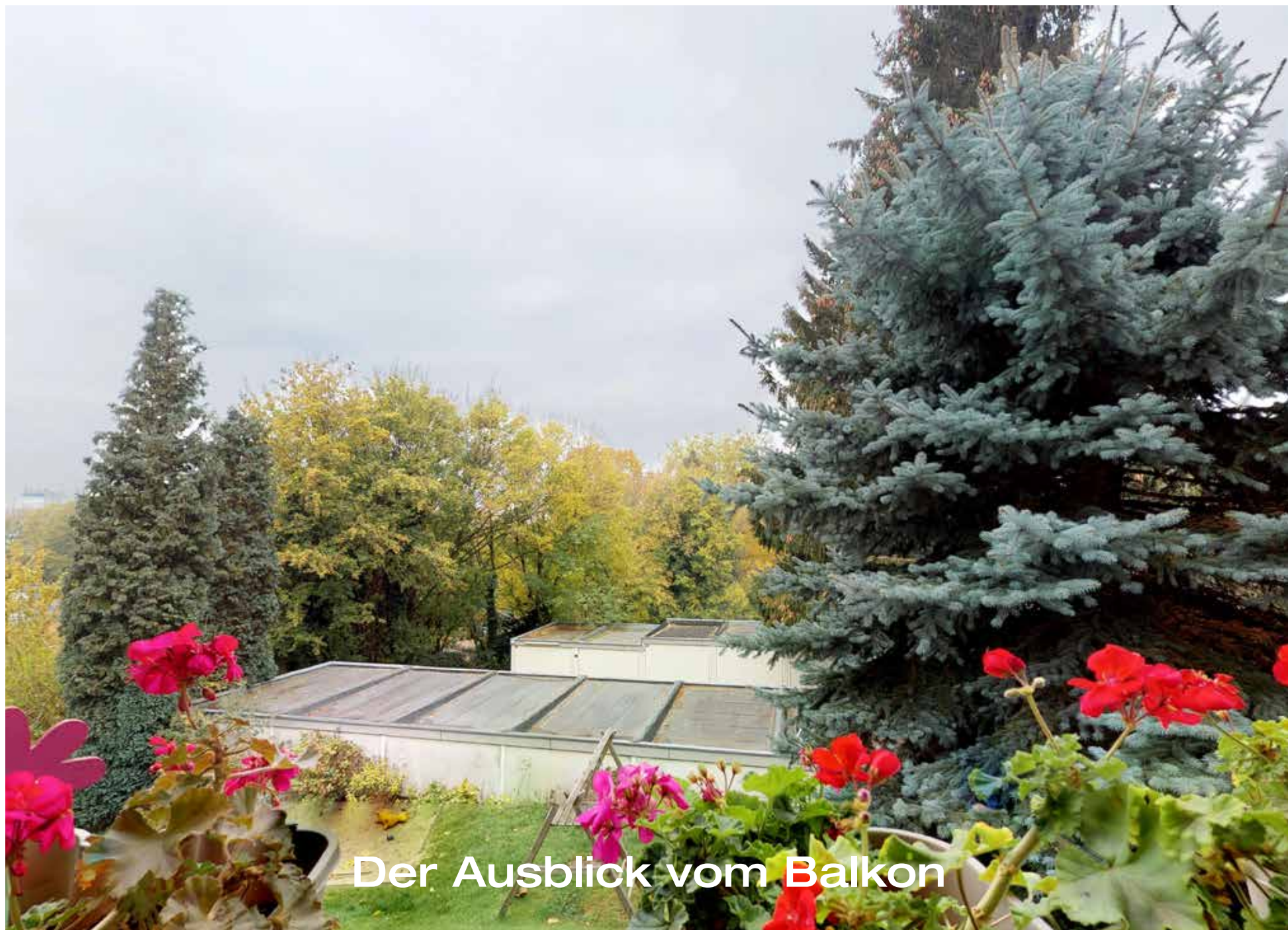
Der Ausblick vom Balkon