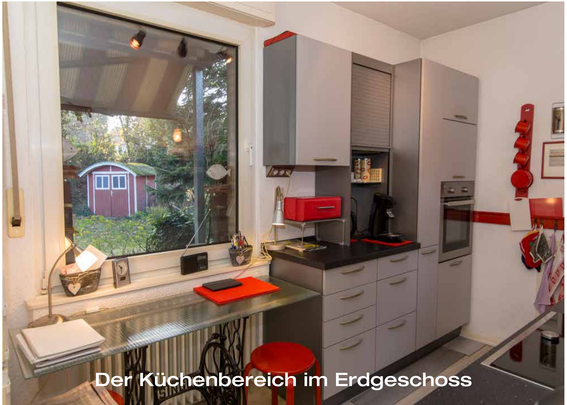
Der Küchenbereich im Erdgeschoss